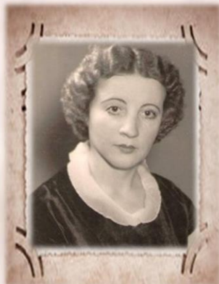
Народная артистка РСФСР и МАССР Раиса Макаровна Беспалова