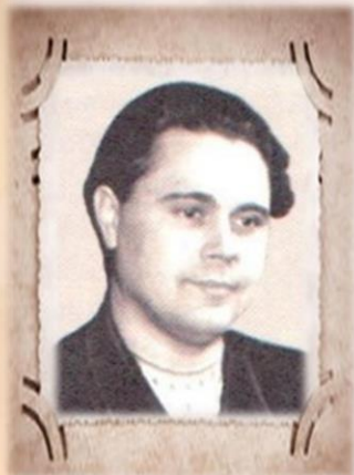
Заслуженный артист РСФСР, Народный артист МАССР Дмитрий Иванович Еремеев